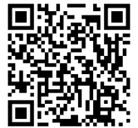
youTube-Kanal für Langwasser

Wie kommt der Kanal in mein Smartphone?: Am besten den nebenstehenden QR-Code abschnappen: Wenn Sie keinen QR-Code-Reader im Handy haben, können Sie sich einen bei Google Play oder aus dem App-Store bei Apple als App herunterladen.